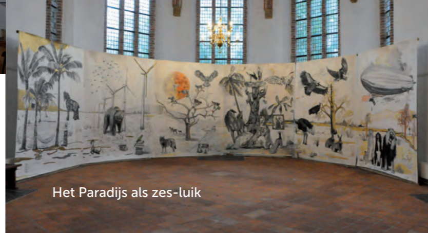
Het Paradijs als zes-luik